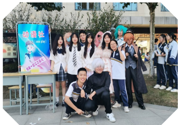
艺表演,使招新活动现场气氛热烈。

动漫社的社员现场随着音乐,尽情起舞,吸引了很多2021级新生的目光;吉他社的成员则边弹边唱,舒缓的音乐在现场飘荡,让正在行走的新生驻足聆听。其他社团也同样用各种方式吸引新生。